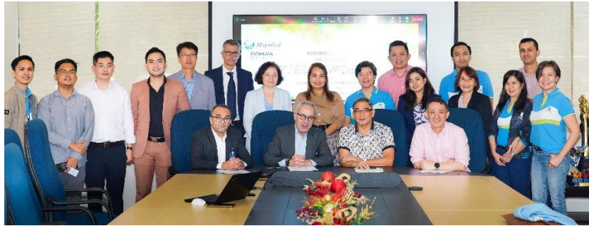
苏伊士与Maynilad公司签署污水处理合同净化马尼拉湾。